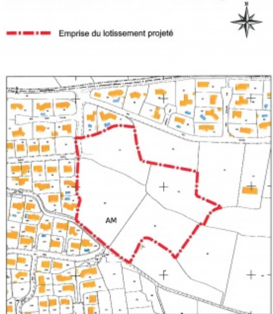
Echelle : 1/2000